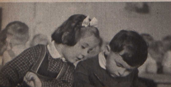
Jelenet a »Ahogy a gyermekek rajzolnak« című csehszlovák filmből (rendező: Jiri Jarabek), amelyet az oberhauseni filmfesztivál II. díjával tüntettek ki