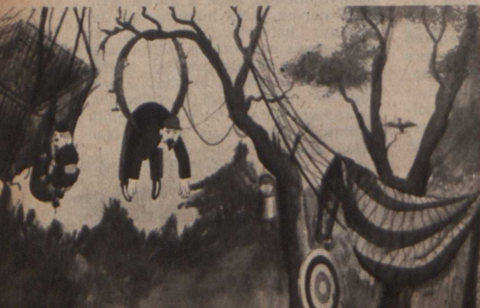
Jelenet az elismerő oklevelet kapott »Ahogy az emberek repülni tanultak« című csehszlovák filmből. Rendező: Jiri Brdecka

Az „Ahogy a gyermekek festenek” című csehszlovák film szellemes kezdő képsora is nyomban magával ragadja a nézőt. Egy prágai utcát látunk. Két gyermek nagy buzgalommal firkál egy ház falára. A kapu alól most, seprűvel a kezében, kilép — a házmester. Meglátja a házfalat rongáló gyermekeket, nagyot kiált és seprűjével elkergeti a rakoncátlan kölyköket. Aztán odamegy a falhoz, hogy szemrevételezze az ákombákomokat. Vele együtt a gép is közelít és im, a falon olvashatjuk — gyerekes írással — a fő címet.