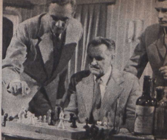
A nagy sakkjátszma

Bár bizonyos tv-filmeket bemutatnak mozikban is, mégis elsősorban a televíziók nézőinek szánják őket. Ez egyaránt meghatározza a forgatókönyv és a rendezés dramaturgiáját. A televízió nézői ugyanis viszonylag kisméretű képernyőn, és ún. atomizált nézőtérben kapják a műsort. Innen ered a televíziószerűség két, a műfaj természetéből adódó, alapvető determinánsa. (A film a nagy- és újabbban a széles-vásznon és a tömeglélektan művészeté!)