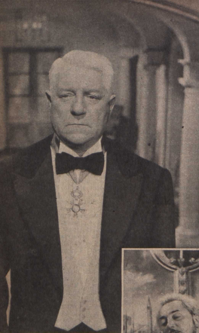
Jean Gabin a »Nagy családok«-ban