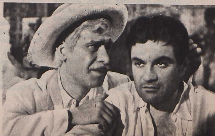
Jelenet az idén Karlov Varyban nagy feltűnést keltett » Flakkeres « című filmből.

A művészek állandó harcban állnak a kormánnyal, amely mindenáron meg kívánja akadályozni a társadalmi és szociális kérdések felvetését. A görög művészek viszont szociális lelkiismeretüktől vezetve és külföldi (első sorban olasz, neorealista és szovjet) példáktól ihletve, egyre több mai problémával foglalkozó forgatókönyvet nyújtának be cenzurázásra. Az erősödő öntudatú nemzeti filmgyártással szemben a kormány a külföldi filmek korlátlan behozatalával védekezik, és nem kötelezi a