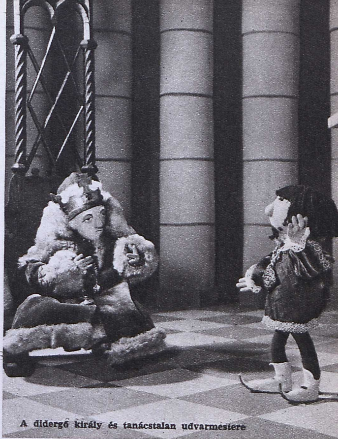
A dídergő király és tanácstalan udvarmestere

Imre István — az író és rendező — gondosan és hűen válogatta ki a legjellemzőbb részeket. A szöveget Kálmán György mondja el Neke- resdország Nevesincs királyáról, aki addig unatkozik, fázik, amíg meg nem tanulja: igazi meleget csak akkor fog érezni, ha megosztja tulajdonát másokkal. Móra mindezt szemernyi bájos gúnnyal tetézi, mert versét azzal végzi: a királyok ilyesmit alig tesznek másutt, mint — »nagy meseországban«. Ott sem maguktól döbbenek rá, megtanítják őket.