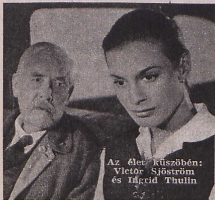
Az élet küszöbén: Victor Sjöström és Ingrid Thulin