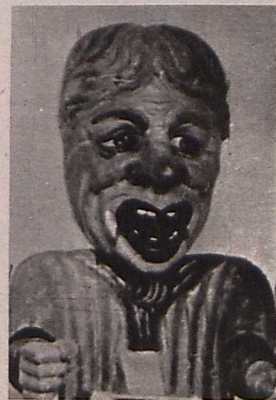
Bábfigura a polyvision vidámparkjából