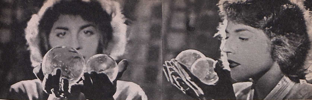
Ime, a magirama: egy női arc három beállításban, egyszerre vetítve

Tény, hogy ebben a film-ben itt-ott felvillan valami különös, emberi, szomorúan groteszk humor. Rövid története — amelyet legalább meg lehet érteni — mindössze ennyi: két szállítómunkás a tenger habjaiból kiemel egy tükrös szekrényt, és megindul vele a városba, hogy elhelyezze. Többhelyütt próbálkoznak hiába, végülis a szekrényt visszaviszik a tenger habjai közé.