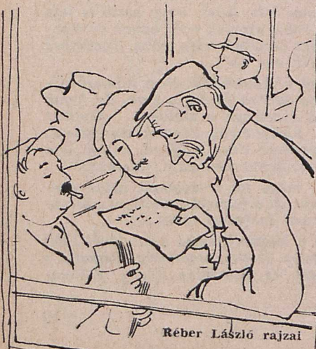
Réber László rajzai

A szél belekap a léggömbbe, mely friss erőre kap, megfeszíti a spárgát és jókedvűen csapkod a levegőben.