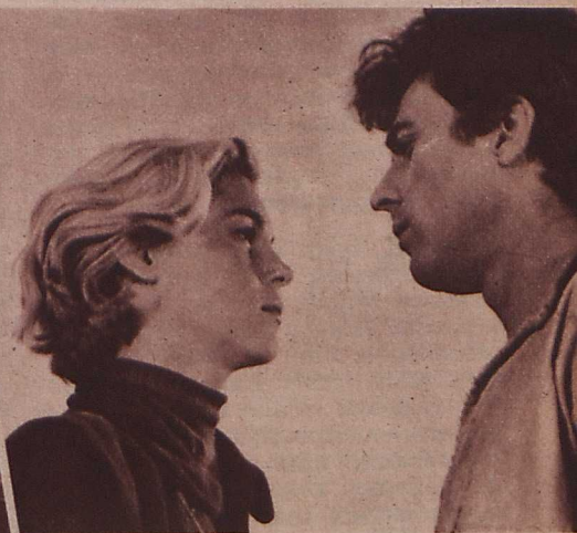
Jelenet a »Partizánok« c. új bolgár filmalkotásból