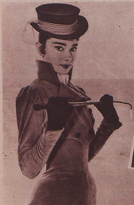
Audrey Hepburn a »Háború és béke« új amerikai filmváltozatának főszerepében