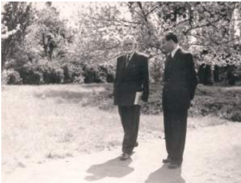
Kodály első látogatása 1950-ben