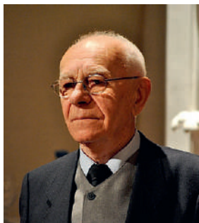
2010-ben a Békés Megyéért-díj

Négy alkalommal rendezte meg az Orosz-Szovjet Zenei Tábor (1979, 1981, 1983, 1985), ahol a ma élvonalbeli művészek jelentős része kisgyerekként vett részt.