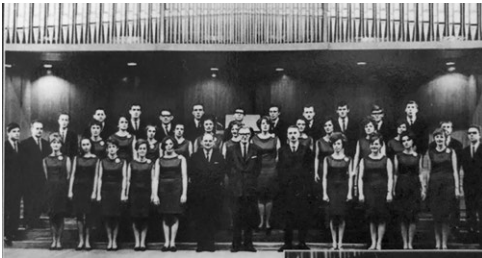
A 10 éves kórus – 1968