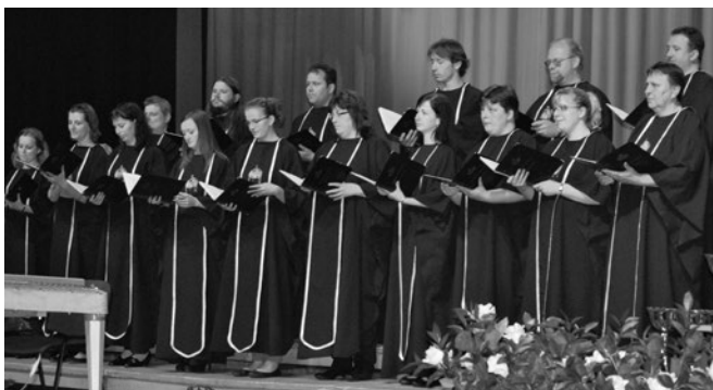
Szent Korona Kórus