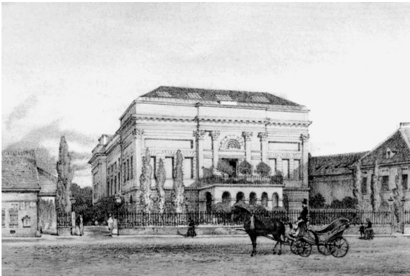
A Pesti Nemzeti Színház az 1840-es évek táján