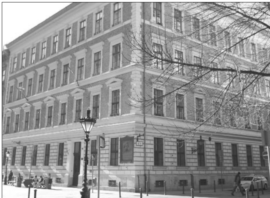
A Gizella királyné leánygimnázium épülete ma.

tak. 21 Az iskolának 72 m 2 -es alapterületű tornaterme és ünnepekre, játékokra ill. testedzésre is igénybe vehető 78 m 2 -es udvara volt. A tanulók úszótanfolyamokra jelentkezhettek, s a tanóra keretében korcsolyázni mehettek, a Belvárosi teniszpályán pedig áprilistól kezdve hetente két délután teniszezhettek is. 22