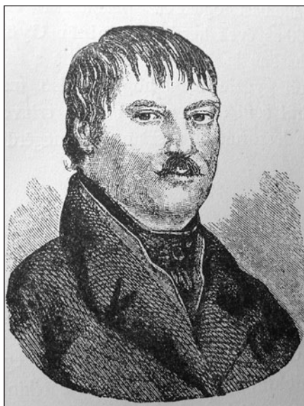
Ruzitska Ignácról készült rézkarc, Ábrányi Kornél 1900-ban megjelent könyvéből

zenei élet bontakozott ki. A környék arisztokratái – az Erdődyek, Esterházyak, Batthyányak és Grassalkovichok – kitűnő zenészekből álló zenekarokat tartottak fenn a városban. Ily módon a főúri rezidenciák muzsikája hozzájárult a város polgári zenekultúrájának felvirágoztatásához is. Batthyány József hercegérsek udvari zenekarának volt a karmestere és zeneszerzője a Sziléziában született Zimmermann Antal (1741–1781). A városban sok kiváló, európai műveltségű muzsikusként élt és működött. Pl. Tost Ferenc (1755–1829), a városi zeneigazgató, az egyik első verbunkos gyűjtemény szerzője és kiadója, Kunnert Jakab (1748–1833), a Szent Márton székesegyház regens chorija, a Morvaországból származó Klein Henrik (1756–1832), aki kezdetben a pozsonyi Notre-Dame zárda zeneigazgatója volt, majd a pozsonyi főnemzeti iskola rendkívüli zenetanáraként vált híressé. Ő volt