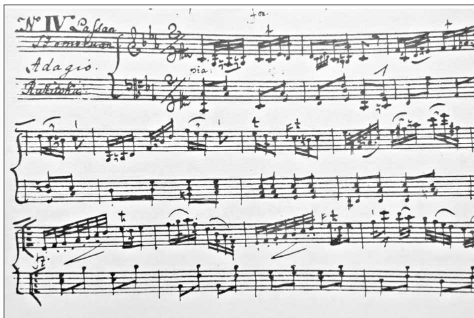
Ruzitska 1823-ban komponált lassú magyarjának a kézírata a Magyar Nóták I. fogásából

(Beethoven, Liszt) is nagyra értékelték. Művei azonban többnyire hallás után terjedtek, mivel Bihari nem jegyezte le őket. Viszonylag későn, 1818 körül ismerkedtek meg személyesen, amikor Bihari (pályája csúcsán) többször megfordult Veszprém megyében. Ruzitskát elbűvölte Bihari játéka. Hatására kezdett komolyan foglalkozni a verbunkos zenével. 42 A mester a fiatal pályatársában nem csak barát, de lelkes rajongóra és támogatóra is lelt. Ruzitska számos veszprémi előkelőséghez beajánlotta Biharit, aki ezután zenekarával gyakran megfordult a környék nemesi kastélyaiban és udvarházaiban. Főleg bálokon, családi ünnepeken szórakoztatta a vidék nemességét. 43