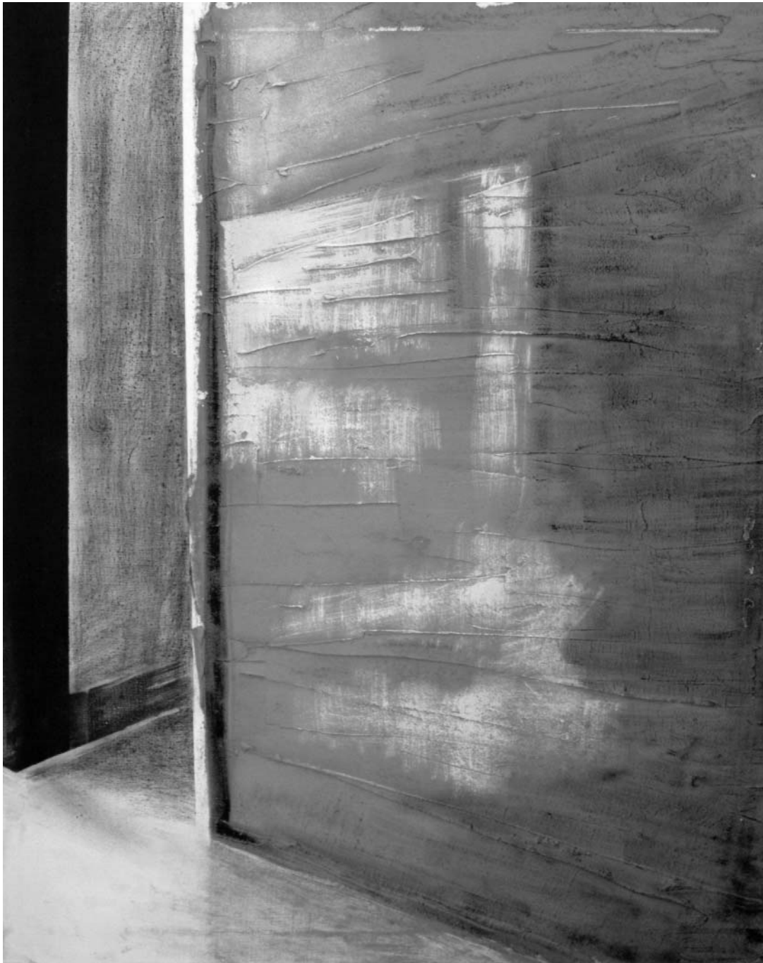
Tolnay Imre munkája

Először a betegek mennek el. Az öregek. A csúnyácskák nem kellenek senkinek. – Buksi! A farkak verdesik a betonfalakat. A sarokban vinnyogva sír egy nagy, szalmasárga öreg. Valamikor szerették őket is. Buksi? Nem hozta magával a képeket. – Nos? – kérdezik tőle. – Megtalálta? Hogyan mondja meg, hogy nem ismeri, akit keres! – Amíg csak lehet, tartjuk őket. De a lehetőségeink végesek. Ez lenne az? Ez a szalmasárga? Mintha, olyan. És a hegyvidékről érkezett. Széles kobakját a vasrácsához szorítja. A szeme alatt laza ráncok. Nézi a gyereket. A kislány hátán apró, narancsszínű zsák. Áll a buszmegállóban. Napközben ritkán járnak a nyolcasok. Ötven éve? A kertekben virágoznak a mandulafák. De nincs már több plakátkommandó a hegyen.