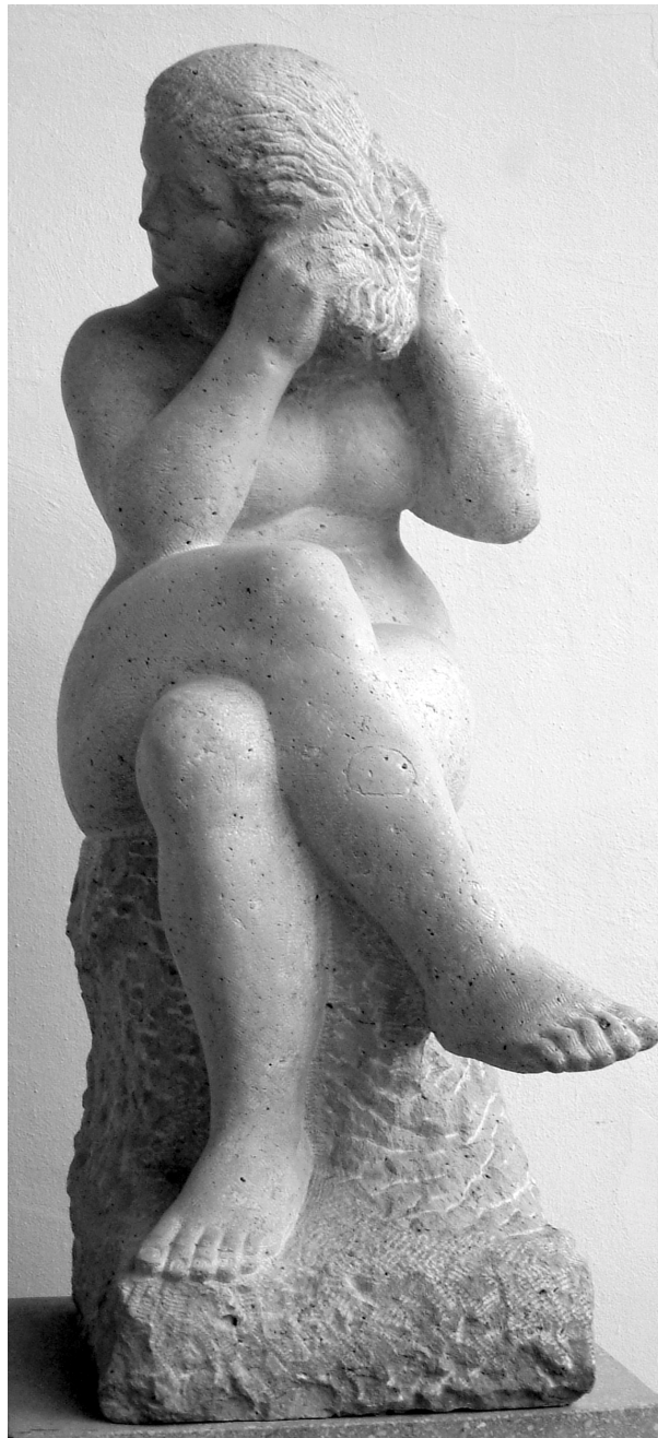
Haját fonó lány