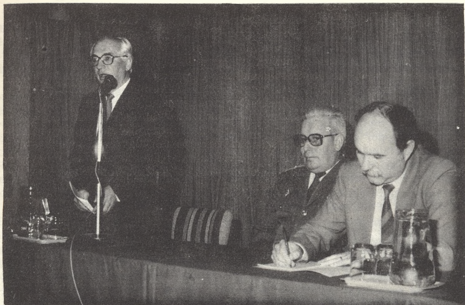
A konferencia elnöksége

lógiai-kriminológiai adatok, információs csoporton belüli hely, hierarchiafok, státuszszerep, értékorientáció, a normakövetés mikéntje, a depresszió válfaja, a felügyelettel való interakció sajátosságai, és így tovább.