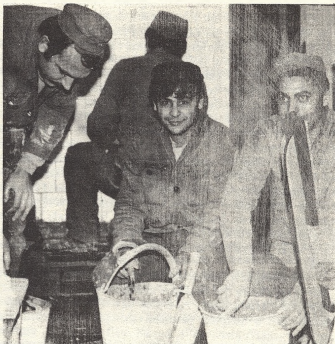
Mintha a sajátjukat építenék...

cselekménytípusok esetében gyakori a részvételük: példa erre a besurranásos, az áruházi avagy a betöréses lopás.