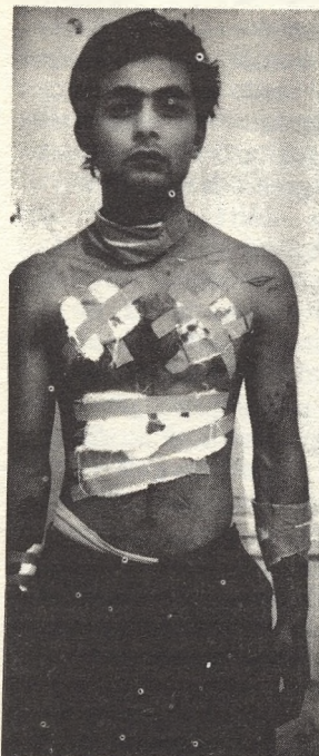
„S halált hozó fű terem gyönyörűszép szívemen”