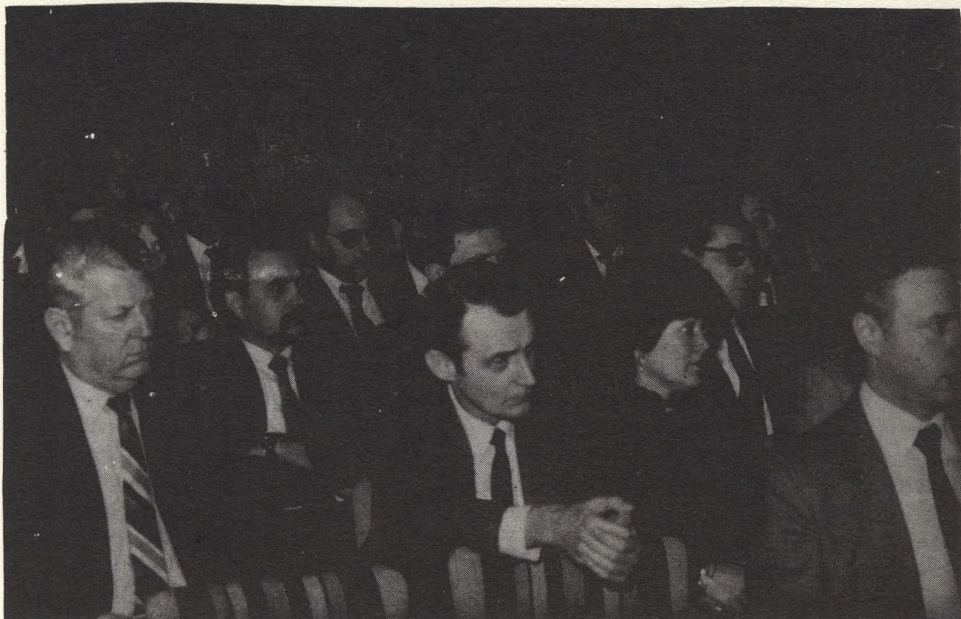
A munkaértekezlet résztvevői

feltárni azt a törvényszerűséget, amely a zártság és a deprivációk foka, a konformizmus erőssége és bizonyos személyiségvonások romlása között fennáll.