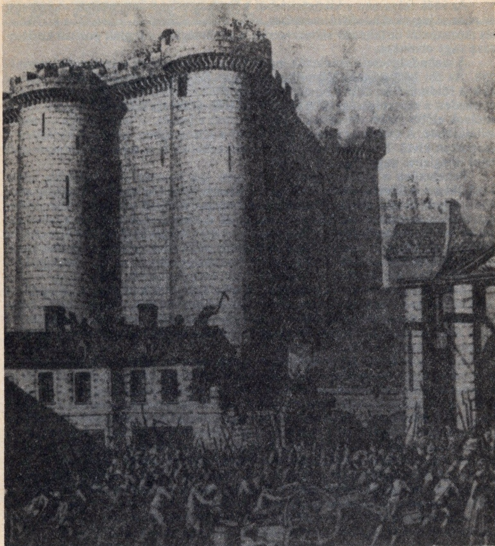
Az abszolútizmus hírhedt börtönei: a Bastille . . .

hogy a neves hadvezér, a marathoni győző, nem tudta kifizetni a büntetéspénzt, s így börtönben halt meg.