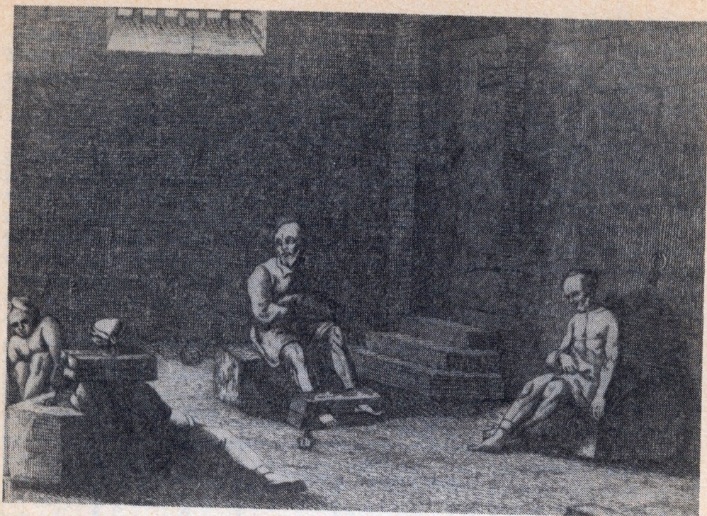
„A tömlőc huszonkét lépcsőfoknyira volt a föld alatt... ”

rettentést szolgálva (a középkori kaloda és pellengér funkcióját magában hordva) egybekötötte valamiféle közszemlére tételei segítségével a megszegyenítést és a szabadság-megvonást, az esetlegesen testi büntetésekkel tetézett börtönbüntetés nyilvánosságát. Nem értünk egyet azokkal a nézetekkel, melyek Manu e rendelkezését úgy értelmezik, mintha az ind börtön célja csupán a pellengérré állítás lenne. Ugyanis nem mehetünk el szó nélkül Schik Sándor azon megjegyzése mellett, hogy bár az ind jogban nem volt döntő szankciónem a börtön, de mint intézmény, már az első ind drámában is szerepelt.