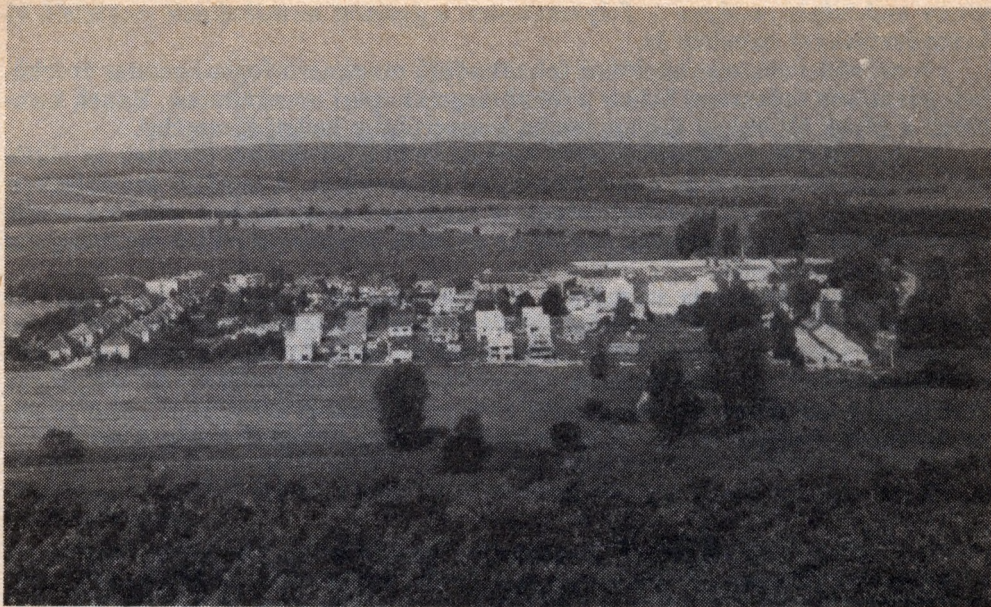
Sopronkőhida látképe 1986-ban