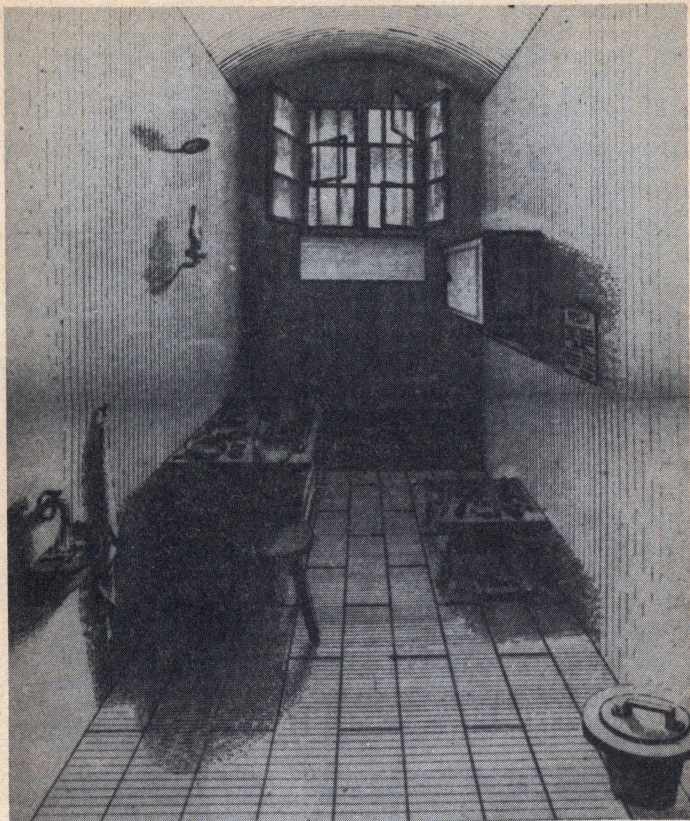
Jellegzetes századvégi zárkabelső — az intézet jubileumi kiállításának anyagából