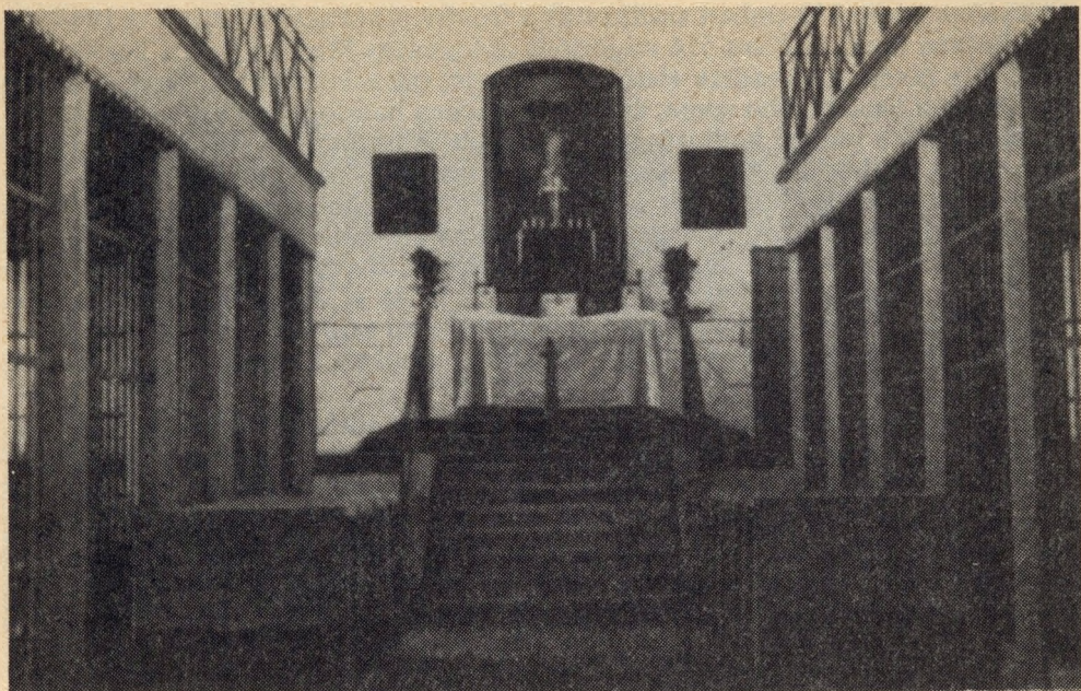
A kir. orsz. fegyintézet házi kápolnája

hatékony munka feltételei. Bár egy-két területen szükség lenne még fejlesztésre, de a nevelést szolgálja a 250 személyes kultúrterem, rendelkezésre állnak a jól felszerelt tantermek, filmvetítőgépek, videoberendezések és más technikai eszközök. Hozzá tartozik az intézet jó működéséhez a mindig büszkén emlegetett sportkomplexum, s a több ezer kötetes könyvtár. Az intézet vezetése mindenkor nagy energiát fordított az oktatásra, amely már 1887-ben megindult. Évente több száz „nebuló” oktatása, képzése folyt, illetve folyik. A felszabadulás előtt két főállású tanító tanított, ma pedig a Soproni Üzemi Dolgozók Általános Iskolája keretében szervezik meg az oktatást.