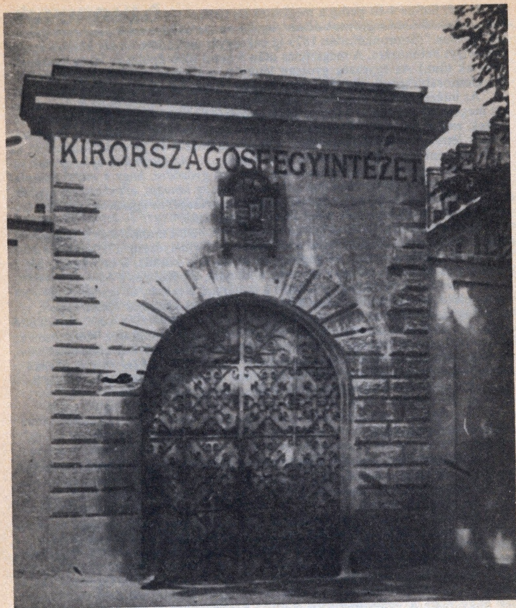
A régi fegyház diszes kapuja

tes hóhérok tizenegy személyt végeztek ki kegyetlenül. A kivégzettek közül a legismertebb Bajcsy-Zsilinszky Endre.