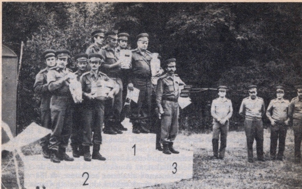
Az országos löverseny legjobbjai

Pisztolycsapatversenyben 257 köreységgel a Márianosztrai Börtön csapata lett a II., 249 köreységgel pedig a Szegedi Fegyház és Börtön csapata lett a III.