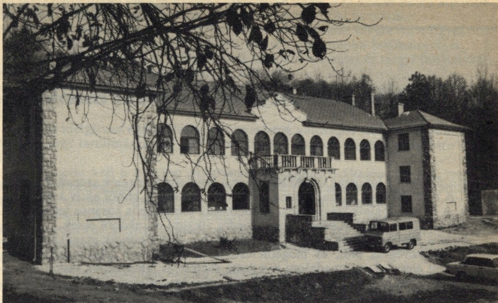
Itt élnek a szigorított javító-nevelő munkára ítélt férfiak

magát a büntetés végrehajtása alól vagy kötelességeit súlyosan megsérti, akkor a szigorított javító-nevelő munka hátralévő részét át kell változtatni szabadságvesztésre. Ez esetben egy nap szigorított javító-nevelő munkának egy nap szabadságvesztés felel meg.