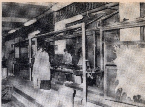
Az Újpesti Bőrgyárban dolgoznak a nők

szükséges feltételeket, valamint a büntetés céljával nem ellentétes jogainak gyakorlását.