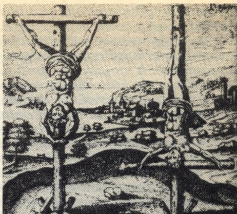
A keresztrefeszítés atipikus esete