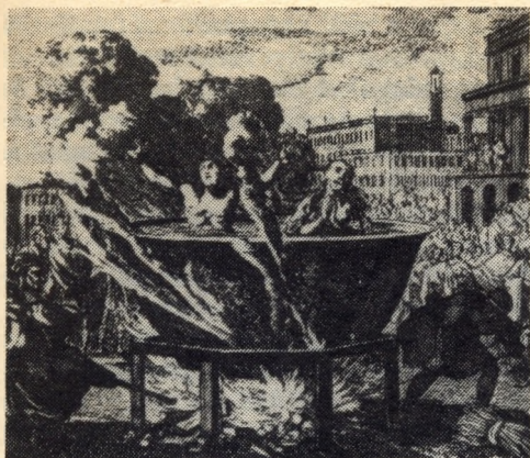
A tűzhálal speciális esete