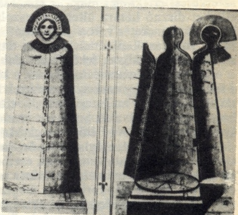
Különleges halálnem: a Nürnbergi Vasszűz

A kivégzési ceremóniával még nem ért véget az elrettentési propaganda. A zsidó jog szerint a végrehajtott ítélet után a holttestet — mindenki tanulságára — napnyugtáig kiakasztották valamely jól látható helyre. Rómában a keresztrefeszítettek az utak mentén hetekig figyelmeztettek az állam büntető hatalmára. Legendáink beszámolnak arról, hogy Szent István — Koppányon aratott győzelme után — ellenfelének testét felnégyeltette, s darabjait az ország négy fontosabb központjába elküldte, hogy ott a várfokra tűzve figyelmeztesse az ország lakóit a szembeszállás értelmetlenségére. Ennek a szokásnak volt egyszerűsített változata évszázadokig a helységek határában álló akasztófa.