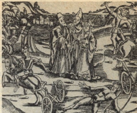
Lovak általi széttépetés