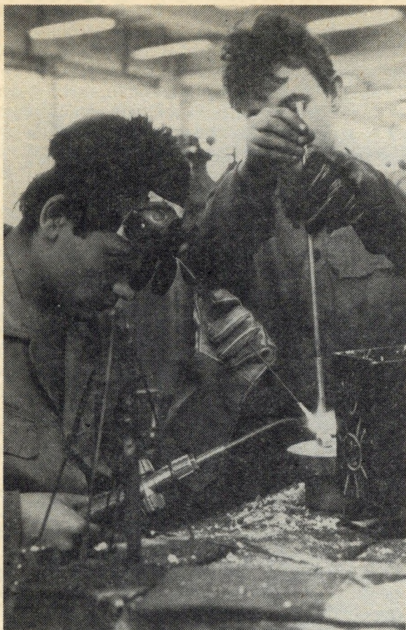
Hegesztők a csőgyártóüzemben

lentősséggel bírnak. A munkáltatás profilja kedvezően alakult, a megszerzett szakismeretet a szabad életben is hasznosíthatják. A munkavégzéssel kapcsolatos anyagi és erkölcsi ösztönzés — a felnőtt elitéltekéhez hasonlóan — azonban még nem elég hatékony.