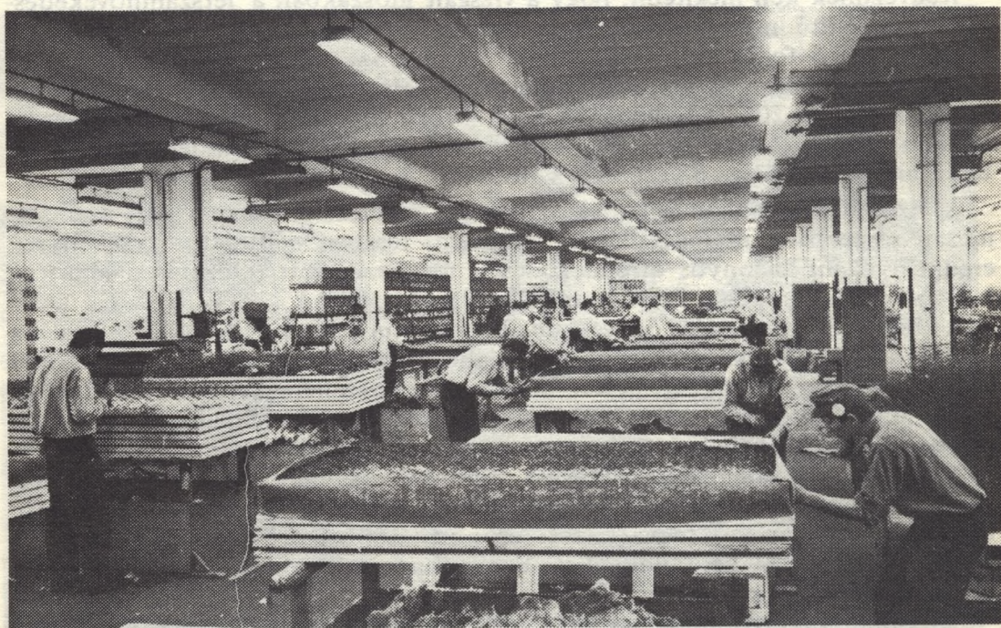
Az elítéltek Szegeden bútort készítenek

A szabadságvesztésre ítéltknél azonban a munkához való joggal kapcsolatos alapelvek is sajátosan érvényesülnek. A munkához való jog a szabad életben