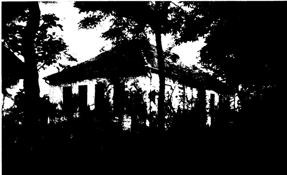
Egyik tanügyi épület.

északi szélén, a központtól 2 km. távolságra, műút mellett, a vasuti állomással szemben terül el. Tanügyi főépületében két tan- és munkaterem, iroda és szertár van tágas előszobával, továbbá az igazgató természetbeni lakása. Külön udvaron a lányok tanügyi épületében ugyancsak 2 tanterem és szertár készült előszobával ellátva. Háztartási konyhája a cselédlakással együtt középen foglal helyet. Oktatási helyiségeinek száma tehát 5. Ez épületek közelében a fás- és szénkamrák, valamint egyéb tanügyi épületek vannak