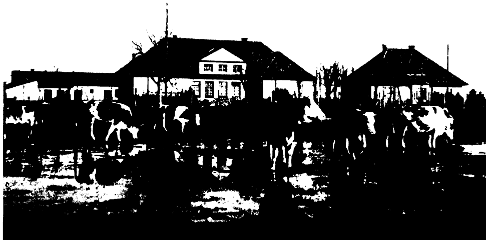
Az iskola főépülete.

A berettyóújfalui önálló gazd. népiskola és gyakorló-területe a község északi szélén, annak központjától 2, a vasuti állomástól 3