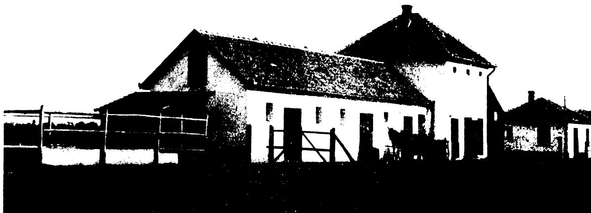
Gazdasági épületek és cselédlakás.

Az iskolának két állandó, konvenciócseledje van. A nyáron hónapos fiút alkalmaz. 1934. évben 2019.48 P napszámot fizetett ki, így közel tíz család megélhetéséhez járult hozzá.