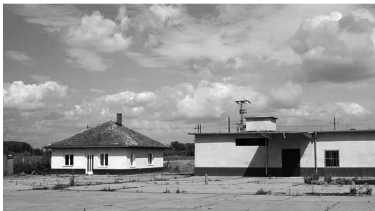
A kötelező beszolgáltatások rossz emléké helye – túl a Tiszán.