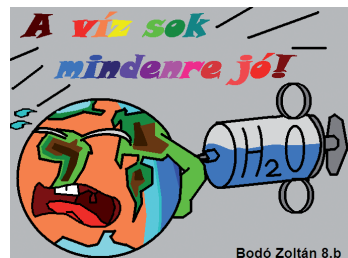
Bodó Máté rajza

A Környezetvédelmi és Vízügyi Minisztérium és a Duna Múzeum „A Víz Világnapja 2010” alkalmából szervezett pályázaton az Algyői Általános Iskola négy diákja indult.