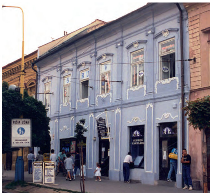
A Pulszky-ház Eperjesen

Vagy még inkább a francia történetírás egyik klasszikus remekműve? Ha a Belvedere felől a bécsi Landstrasse kerületen át a Duna-csatornához tartunk, az egyik utcácskában pompás empire palota bukkan elénk: Andrej Kirilovics Razumovszkij hercegnek, minden oroszok cárja bécsi követének építtette 1806-ban Louis de Monoyer. A herceg mecénási tevékenységét számon tartja a zenetörténet, és joggal, mert itt mutatta be csodálatos V. szimfóniáját Ludwig van Beethoven. Évtizedekkel később a teleknek a mai Salmgasse felé eső részét eladták, hogy