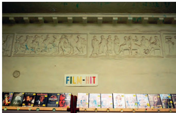
A Parthenon-fríz másolata az eperjesi Pulszky-házban

A londoni St. Petersburg Place nevű utcában több templom is található. Egyik végében egy óriási zsinagóga emelkedik, középen egy anglikán templom, a másik végében pedig, ahol a Moscow Roaddal találkozik, egy pravoszláv templom tárja kapuit kifelé, hogy a híveket becsalogassa. A Máté apostol nevét viselő anglikán istenházával szemben van egy ház, amely olyan, mint az angol házsorok számos helyen, vagyis mintha egy háztömb lenne, de mégsem az: ahány kapu, annyi ház. Mindegyikhez három ablak tartozik, a szerkezet még a 18. századból való, György-kori,