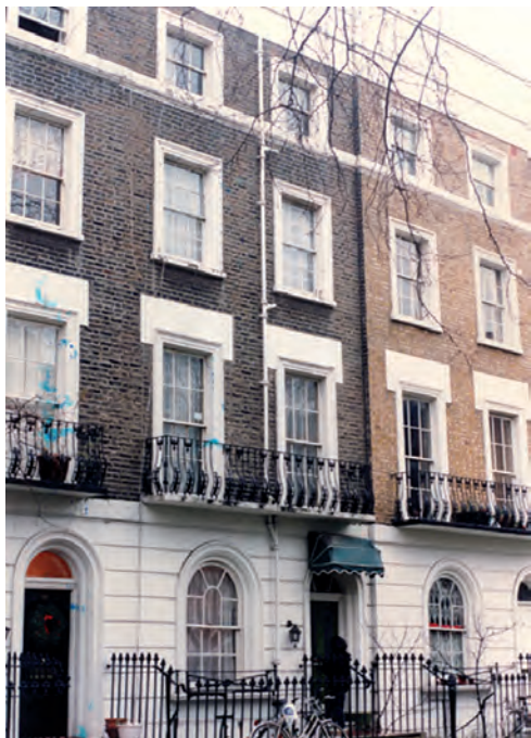
A Pulszky-ház Londonban

Pulszky sokat tett a Kütahyába internált Kossuth kiszabadításáért, még többet angliai és amerikai körútjainak sikeréért. Louis Bonaparte államcsínyre azonban jó néhány esztendőre visszafogta az emigrációs reményeket, és miután felesége és gyermekei is szerencsésen kijutottak, az ötvenes években – mai szóval élve – szabadfoglalkozású értelmiségiként, cikkei, előadásai honoráriumából, továbbá a Walter nagyszülők segítségével tartotta el családját. Tudománytörténeti érdeme, hogy egy nevezetes előadásával komoly hatást gyakorolt a British Museum kiállításpolitikájának megváltozására is. Mindezek miatt komoly a remény, hogy születésének bicentenáriuma a St. Petersburg Place épületén tábla örökíti meg londoni tartózkodásának emlékét.