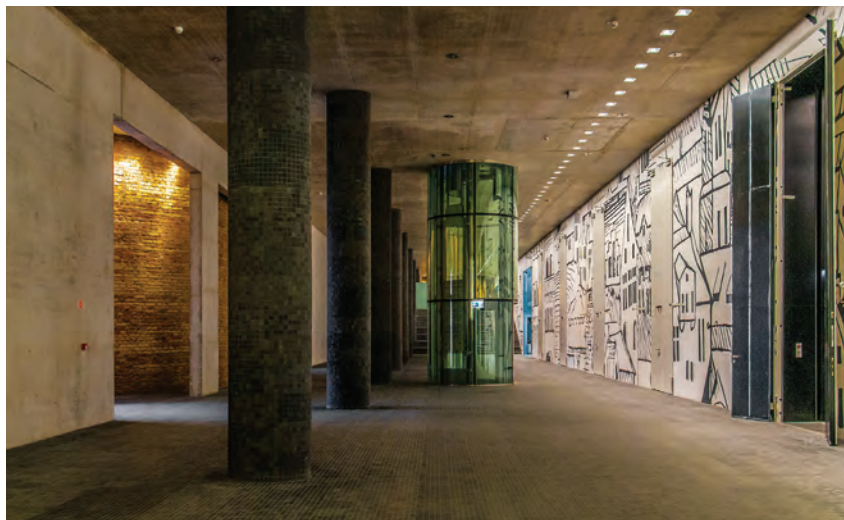
A geometrikus kert alatti többcélú terem előcsarnoka

Az együttes helyreállítása interdiszciplináris feladat volt, amelyben az építészeti, művészettörténeti és restaurátori feladatokat a mérnöki tevékenységekkel összhangban kellett megvalósítani, ehhez csapatmunkára volt szükség. 5 Az idő rövidsége, az előkészítés hiányosságai következtében a tervezés folyamatai egymásra csúsztak. Nem volt a területen átfogó régészeti feltárás, csak szondázó feltárások történtek. Az együttes elemei tele voltak provizóriumokkal, az eredetiek amortizálódott, romos állapotban voltak. A kert történeti szegélye a helyreállíthatóság határán volt, de még így is hordozott valamit egykori szépségéből, festőiségéből. Helyreállítási és fejlesztési tervünkben a történeti együttes eredeti kontextusának visszaállítására törekedtünk, megtartva az erődrendszer elemeinek hangsúlyos urbanisztikai rangját, városképi jelenlétét, hogy az új elemek helyének kijelölése és formálása harmonizáljon a meglévőkkel a városképben.