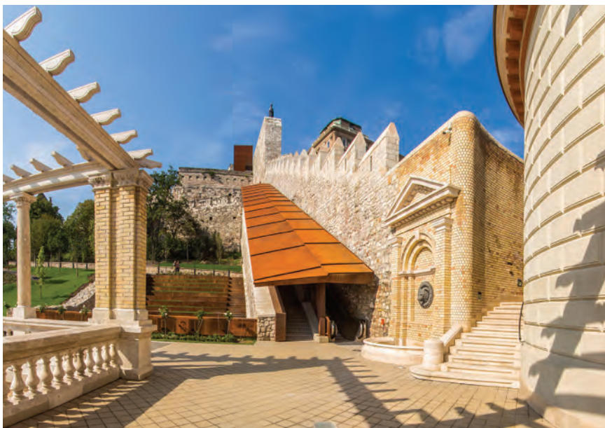
A Vízhordó folyosó tetejére épült lépcső és mozgólépcső corten acél védőtetővel

A régészeti szemlélet nyert teret, amely felszínre kívánta hozni a középkori magyar művészet emlékeit. Ennek a középkor felé fordulásnak a főszereplői Kotsis Iván, Gerő László és Lux Kálmán, akiknek a két háború közötti esztergomi palota rekonstrukciója volt az ideálja. A budai ásások Gerevich László vezetésével felszínre hozták a palota 13. századi maradványait és töredékeit, a Zsigmond- és Mátyás-kori falakat. Az ezekre épülő rekonstrukciók csak 1949-ben indultak meg. Az a tény, hogy nem kezdték el a királyi palota sérült történelmi szövetének helyreállítását, mint más városokban, a közelmúlt történelmével szembeni távolságtartásnak tudható be. Emellett a Habsburg-ellenesség is szerepet játszott, párosulva a magyar középkor iránti romantikus szemlélettel.