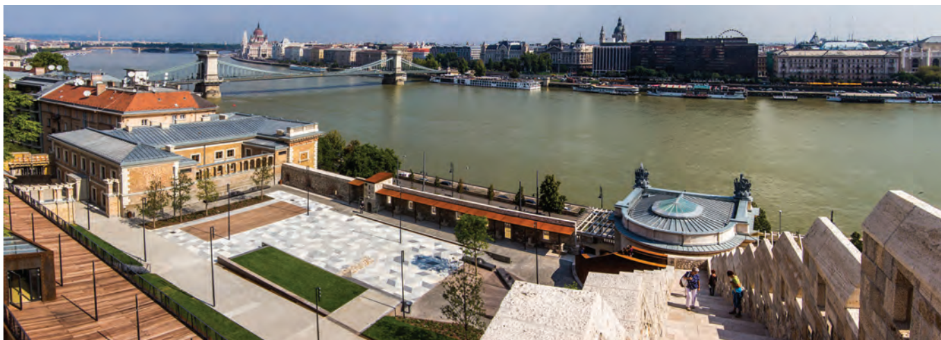
Az Öntőház udvar, a Duna felől ülőfülkés zárófallal, háttérben a királyi testőrség egykori szálláshelyével

A téglafalak mögött, a lépcsős rámpamű alatt új terek jöttek létre. Az Ybl-terv implicit lehetőségeit felismerve egyedi térsorokkal gazdagítottuk a helyreállítást. A rámpa rézsűjével ritmikusan emelkedő támvégek sora sajátos atmoszférát kölcsönöz az új térnek. A Dunához lenyúló keleti középkori várfalak fragmentumai átszelik az északi rámpaművet, és megjelennek az újonnan létrejött kéttraktusos térben. A déli rámpa alatti tér többlete, hogy összenyitható az előcsarnokkal. A mintegy 900-1200 főt befogadó, mobilfallal osztható rendezvénytér valójában a környezetétől akusztikailag független doboz, a végein kigördíthető lelátókkal. Különlegessége a 21 ezer ledpontból álló fénypontfelület, valójában az oldalfalakat betöltő pixelsoros képernyő, amely az eseményekhez programozható.