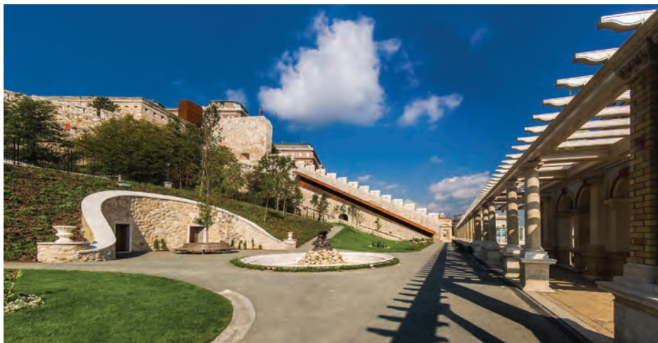
A Széles út sétány dél felől, baloldalt grotta, előtte Triton szobros medence, háttérben a Déli kortinafal lőréseseinek lépcsős pártázata

gosan alkalmazott stílusa. 1840-ben a Müncheni Képzőművészeti Akadémián töltött évei alatt járt Észak-Itáliában és Toszkánában, majd a Károlyi család anyagi támogatásával hosszabb időt töltött Itáliában. Nem meglepő, hogy a Várkert bazár együttese számos itáliai építész és épület hatását mutatja az ókortól a reneszánszig.