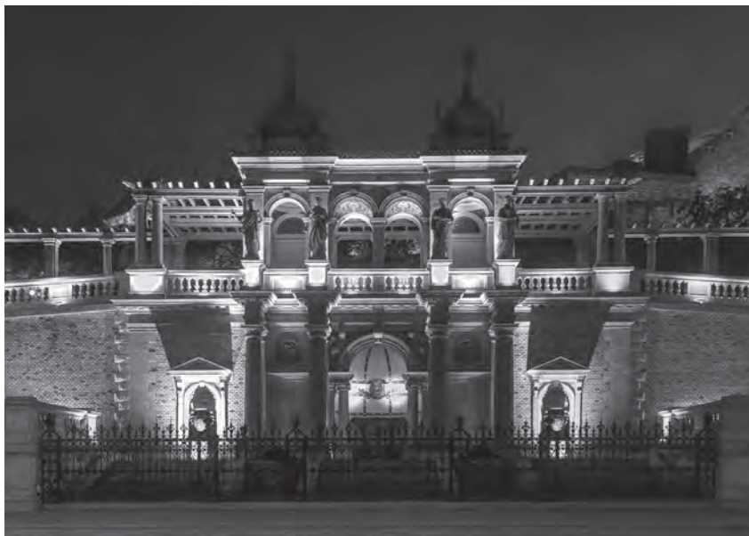
A Gloriette esti díszkivilágításban