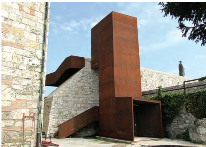
A Déli kortinafal pengéjére érkező gyorslift és kijárata a déli zártudvarban

A pavilonok dongaboltozata Maxentius 312-ben épült római bazilikáját, a mázaskerámia-elemek a firenzei Capella Pazziban lévő Luca della Robbia-majolikákat (1460) juttatják eszünkbe. A bécsi Schönbrunn gloriattjén (1775) látható tróféák megjelennek a pavilonok sarokpilaszterein. A Lépcsőpavilon lépcsőházi terének ideálterve megtalálható Palladio építészeti traktátusában (1570). Az Erzsébet lépcső loggiája Károlyi Alajos pesti palotakertjének Ybl által 1862-ben tervezett gloriattjét idézi, de itt Gartner müncheni Feldherrnhalléja is említhető 1844-ből.