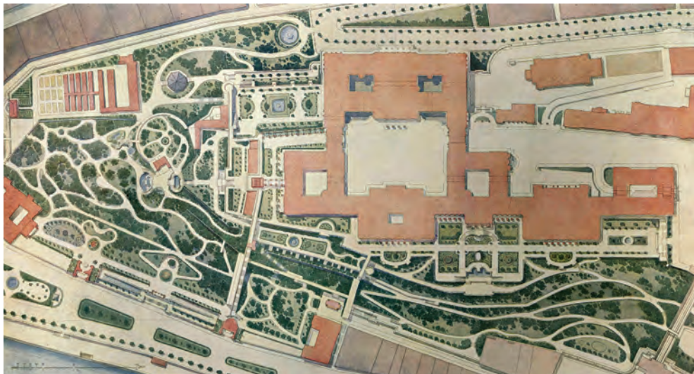
A Hauszmann-iroda kertterve, a palotát körülvevő királyi kertekről 1900-ból

A főalakok felett rézsútosan találhatók azok inguidói, a főalak attribútumát hordozó mellékalakok. A homlokzatra nyíló nyitott előcsarnok hátfalán Flóra, a tavasz és a virágzás istennője és Zephyr, a nyugati szél istene látható, együtt