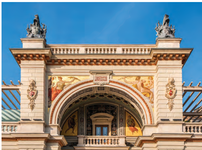
A déli Fülkes pavilon emeleti homlokzata Than Mór mitológiai alakjaival, a saroklizenákon spíáter trófeákkal

intenzív közlekedési tengely kiépítését jelentette a Vízhordó folyosó megnyitásával. Ezzel – az Ybl-korszak után – újra elindult a királyi palotát övező erődrendszer integrálása a palota szintjére való feljutás gyalogos útvonalába.