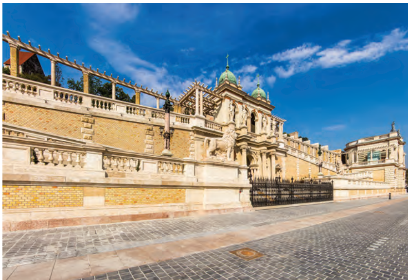
A kép bal oldalán a déli lépcsős rámpa, középen a Gloriette a kertszínter pergolával szegélyezve, túloldalán az északi rámpa, mögötte a kortinák pengefalai

Az együttest északon a Királyi Testőrség tagjainak szállásépülete (Gebaude A), délen két bérpalota zárja (Gebaude E, F). A palotákat tíz-tíz félköríves nyílású bazár követi. A déli bérpalotához kapcsolódó első nyílás az Erzsébet lépcső bejáratát rejti. A bazársorokat nyitott fülkés emeletes pavilonok zárják, északon a Lépcsőpavilon (Stiegenpavilon), délen a Fülkés pavilon (Saalpavilon). A pavilonok közötti tengelyre komponálva a kettős kupolás Gloriette (Mittelbau) két oldalán ünnepélyes lépcsős rámpák vezetnek a kerti terasz sétányára, a Széles útra. A Széles sétány az Erzsébet lépcső loggiáját köti össze a Déli kortinafal végére komponált díszkúttal. A sétányra fűződnek a hegy felől a kert épített elemei. A Gloriette tengelyében a víz-medencébe komponált Triton-szobort a kert lejtőjében grotta öleli. A grotta két oldalán