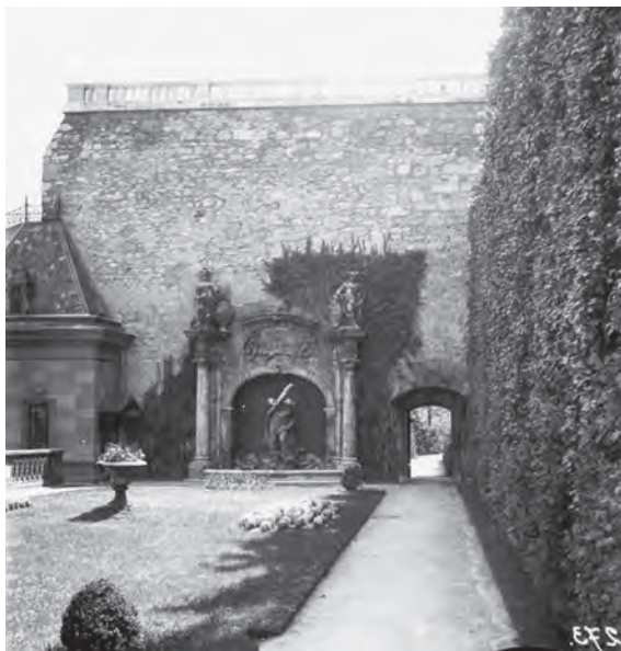
Keleti falszoros, középkert. Archiv felvétel, 1970-es évek

Ybl természetes módon integrálta a területen lévő középkori várfalakat és falmaradványokat kerti együttesébe, valamint a palota szintjére való feljutás útvonalába. A Várkert bazár építése szervesen összefüggött a várba való feljutás gyalogos útvonalainak kiépítésével. Ugyanakkor az előtte lévő tér kiépítésével közvetlen kapcsolat jött létre a kert és a Duna-part között. A Várkert fejlesztését Hauszmann Alajos folytatta, és számos jelentős épülettel (a várkertészet épületei) és szobrászati elemmel gazdagítva folytatta az Ybl által elkezdett munkát. A királyi