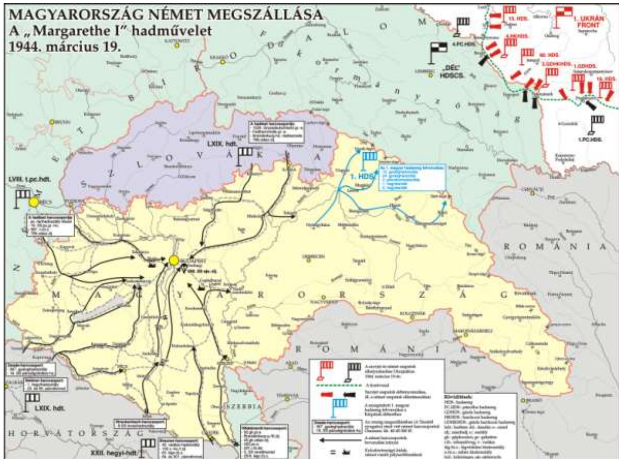
( Eredeti megjelenés: História 2004/9, Rubicon 2014/3.)

Azért, hogy mindez magyar részről nem váltott ki ellenállást, elsősorban Horthy Miklós a felelős. A kormányzónak mint államfőnek és legfőbb hadúrnak jelentős szerep jutott a német megszállással kapcsolatban. Említettük, hogy Horthy fontosságával a németek teljes mértékben tisztában voltak. Világosan látták, hogy amennyiben Horthy nem mond le a kormányzói posztról, akkor azzal legitimálja a német megszállást, s így a magyar hivatali apparátus is együttműködő lesz. Jól érzékelték Horthy gyengeségeit is. Azt, hogy csupán régi vágású politikus tanácsadóit (Bethlent, Kállayt, Keresztes-Fischert és még néhány személyt) kell eltávolítani a környezetéből ahhoz, hogy Horthy „erkölcsi érzéke”, valamint „politikai tisztánlátása és cselekvőképessége” jelentősen csökkenjen. Azt is világosan látták a németek, hogy szükség esetén családtagjaival lehet megszarolni az idős és több jelentős családi tragédián túlesett Horthyt.