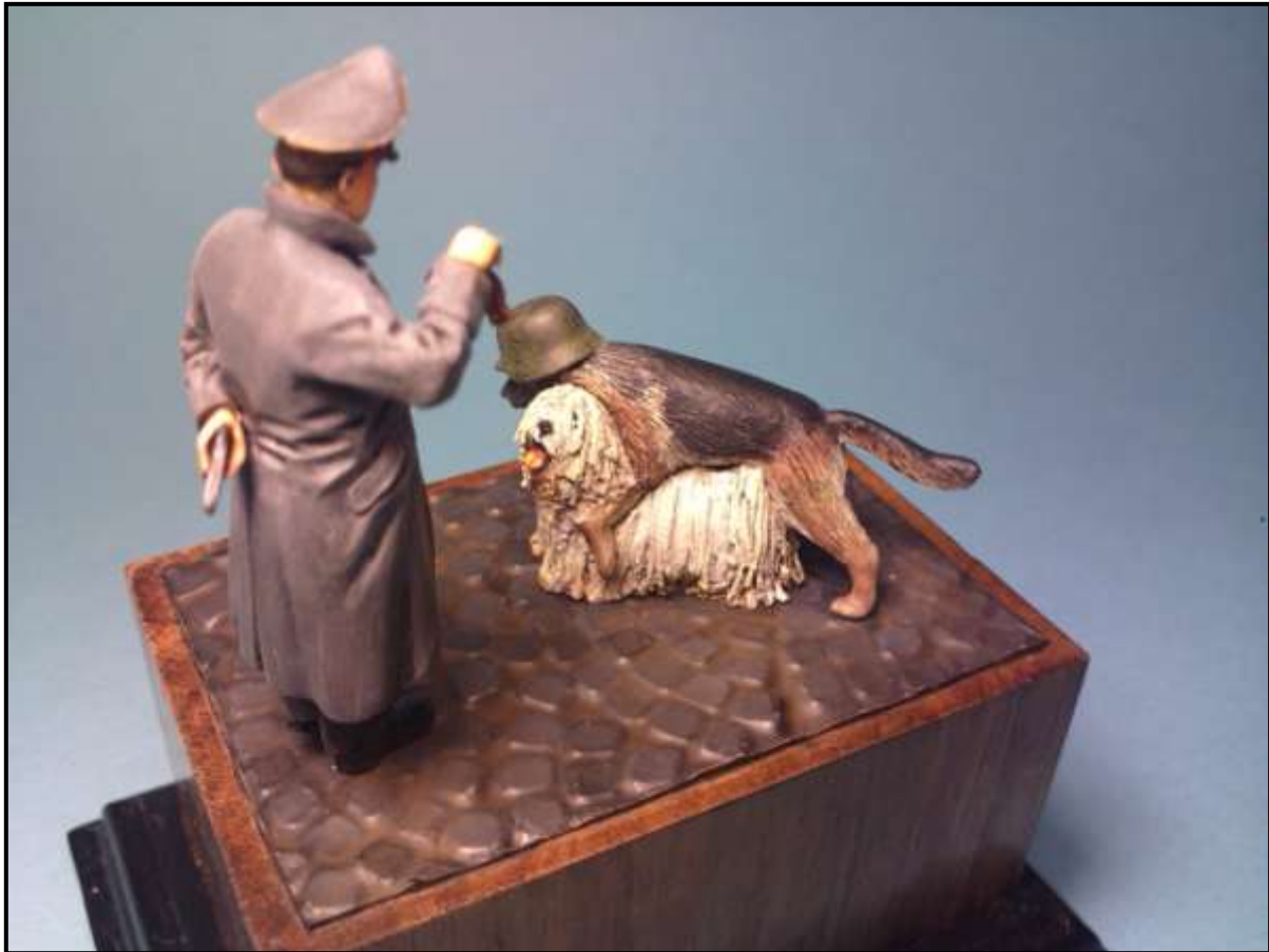
A Proli Depp Illuminárium blog „alternatív emlékműterve”. (Uo.)

A német megszállás évének számos tanulsága fogalmazható meg. A magyar felelősség, az állami szuverenitás és a lehetséges mozgástér kérdésében világosan látszik, hogy a kép ezúttal sem fekete vagy fehér, nem adható igen/nem típusú válasz ezekre a kérdésekre. A felelősség ugyanis megoszlott az egyes szereplők között, igaz nem azonos mértékben. A magyar állam szuverenitása pedig nem szűnt meg teljesen, hanem korlátozottá vált.