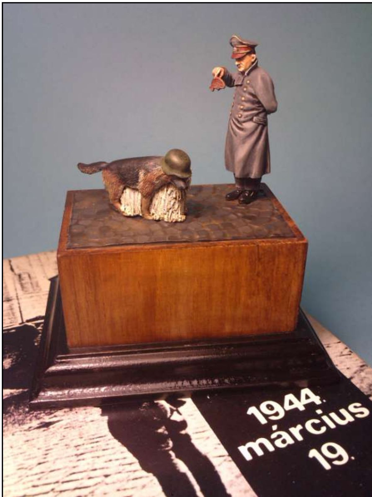
A Proli Depp Illuminárium blog „alternatív emlékműterve”. (Eredeti megjelenés és szöveges leírás: http://prolidepp.tumblr.com/post/80056927088/a-nemet-megszallas-igaz-tortenete-vegyes )