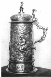
BRASSÓI KUPA Aranyozott ezüst. XVII. század közepe. A Művészeti Múzeumok Barátai Egyesületének örök letéte az Orsz. M. Iparművészeti Múzeumban. 1932