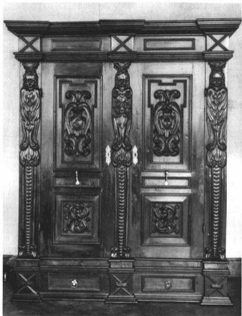
RUHASZEKRÉNY. Északmagyarország, XVII. sz. utolsó harmada Az Orsz. M. Iparművészeti Múzeum új szerzeménye