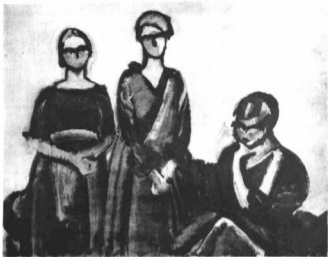
HARALD GIERSING: HÁROM HÖLGY FEKETÉBEN