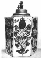
PALACK. Északmagyarországi habán fayence. 1663 Az Orsz. M. Iparművészeti Múzeum új szerzeménye