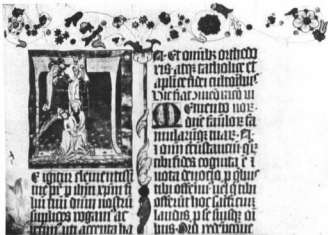
APATHI LUKÁCS EGRI PRÉPOST MISEKÖNYVE 1489-BŐL Ma Pozsonyban

PÁRISI AUKCIÓEREDMÉNYEK. A válság, amely a múlt esztendőben oly nyomorúságosan éreztette hatását az európai és amerikai műkereskedelemben, újlátszik, enyhülőben van. Legalább is ezt a reményt ébresztik két nagy párisi gyűjtemény nemrégiben lezajlott aukciójának eredményei, amelyekben ugyan nem érték el az inflációs évek szinte csillagászati számainak, de igen kitűnő és — reális áronk ütötték le a kikiáltott műtárgyakat. A két kollekció közül a Pacquement -gyűjteményben főleg a késő impresszionizmus mesterei és a posztimpresszionisták voltak képviselve. A Georges Petit-galériában december 12-én aukcióra került 73 festmény közül a legnagyobb árat Vincent van Gogh középnagyságú (73×92 cm) festménye, a „ Méridienne ” érte el, amely 280.000 francia frankért (kb. 62.000 P) cserélt gazdát. Cézanne kisméretű virágvázás csendélete ( Pots de fleurs , 46×55 cm) 168.000, Estaque-i tájképe 112.000 frankot ért el. Renoir „ Fürdőző nők ” c. képéért 64.000, Puvis de Chavannes „ Anyaság ”-jáért 70.000 frankot fizettek. Meglepő magas áron kelték el az élő mesterek képei is: Vuillard egy csendéletét, amelyért Pacquement 1914-ben még 5000 frankot fizetett, 57.000 frankért vette meg a Luxembourg-múzeum, Henri-Matisse két csendélete pedig 48.000, illetve 75.000 frankért talált gazdára.