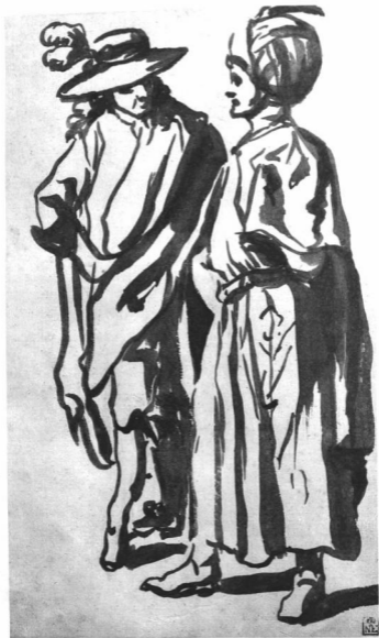
ELSHEIMER ADÁM (1578—1610):

Alaktanulmány a művésznek a londoni National Galleryben lévő „Szent Lőrinc vértanúsága” című képéhez. Biszter, csetrajz. Az Esterházy-gyűjteményből. Orsz. M. Szépművészeti Múzeum