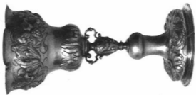
SERLEG. Aranyozott ezüst, M. 25,2 cm. Erdély, XVII. sz. második fele Magán tulajdon