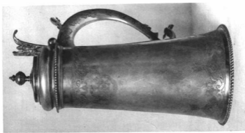
FEDELES DISZKUPA. Ezüst, részben arannyal ÉH31 vésett Blinffy-Wesselyi címere és 1712. évszám M. H. mesterjegye. M. 36 cm. Brassó Magánulajdon