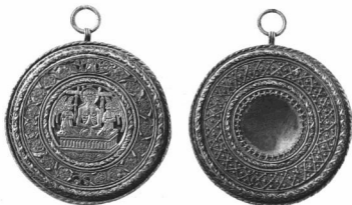
MELL-EREKLYETARTÓ. Aranyozott ezüst. Átm. 11. cm. Erdély, 1451 A Magyar Nemzeti Múzeum tulajdona