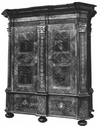
KÉTAJTOS RUHASZÉKRÉNY. Erdély, XVIII. sz. második fele Orv. báró Bornemisza Gyuláné tulajdona