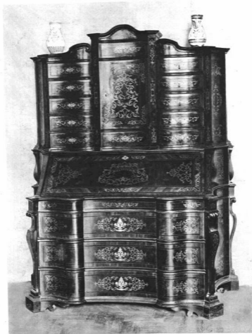
ÍRÓSZEKRENY, DIÓFABORITÁSSAL, GAZDAG ARABESZKES JÁVOR- ÉS KÖRTEFABERAKÁSSAL Nagyszében, XVIII. sz. első fele Az Orsz. M. Iparművészeti Múzeum tulajdona