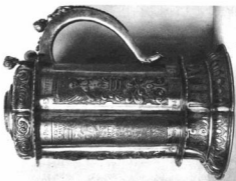
I. RAKOCZI GYÖRGY NAGY KUPAJA Aranyozott ezüst. M. 28,5 cm. Erdély, XVII. sz. első fele A Magyar Nemzeti Múzeum tulajdona