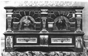
LADA. Fenyőfa, színesen festett és aranyozott díszítésekkel. Elöl fölökkben Lukrécia és a Szeretet allegóriáinak félalakjai, talapzatán magyar viseletű férfi és nő alakjával. Erdély XVII. sz. Az Orsz. M. Iparművészeti Múzeum tulajdona