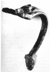
RÓMAI BRONZEDÉNY FÜLE ÁLLATFEJVEL