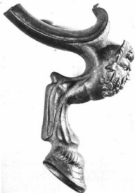
RÓMAI BRONZKANDELÁBER LÁBA SATIRALAKKAL