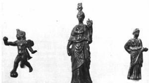
RÓMAI SZOBROCSKÁK Székesfehérvári múzeum