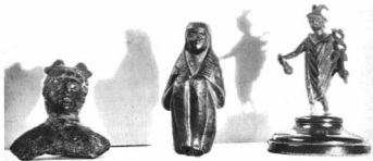
RÓMAI SZOBROCSKÁK Székesfehérvári múzeum