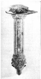
RÓMAI BRONZLÁBAS NYELE KOSFEJVEL