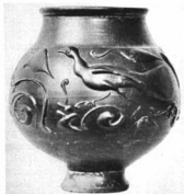
TERRA SIGILLATA EDÉNY Székesfehérvári múzeum