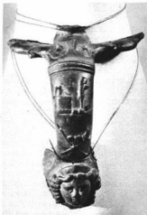
RÓMAI BRONZEDÉNY FÜLE MEDUZAFEJVEL