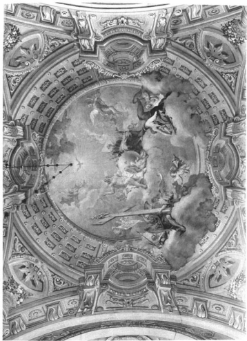
C. F. SÁMBACH SZENTÉLY FRESKÓJA: A SZENTHÁROMSÁG