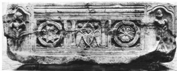
SZENT ISTVÁN KÓKOPORSÓJA. Hosszanti oldalak Nagyar Nemzeti Múzeum