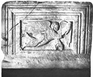
SZENT ISTVÁN KOPORSÓJA. Mellő oldal Nagyvár Nemzeti Múzeum

A szentényilvánítság után a test megmaradt részelt véglegesen kiemelték a koporsóból s ezüst tartóba helyezték. Valószínűleg szét-hordták egyes darabjait a különböző egyházakba és Székesfehérvárott nem sok maradt belőlük. Az üres kőkoporsó szükségképpen az egyházban maradt. De könnyen