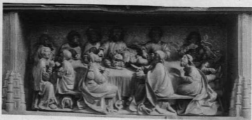
AZ UTOLSÓ VACSORA. A SZEPESSZOMBATI FŐOLTÁR PREDELLÁJA