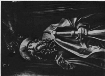
LÓCSEI PÁL MESTER: SZENT JAKAB SZOBRA A LÓCSEI FŐOLTÁRON. Réselei