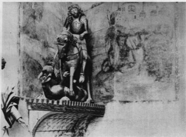
SZENT GYÖRÖY LOVASSZOBRA A LÓCSEI SZENT JAKAB TEMPLOMBAN