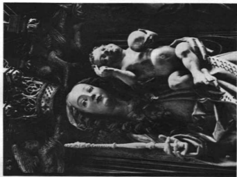
LÓCSEI PÁL MESTER MADONNA-SZOBRA A LÓCSEI FŐOLTÁRON. Réselei. XVI. század eleje