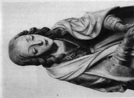
LÓCSEI PÁL MESTER: SZŰZ MÁRIA SZOBRA A LÓCSEI BETLEHEMBŐL. Bécs