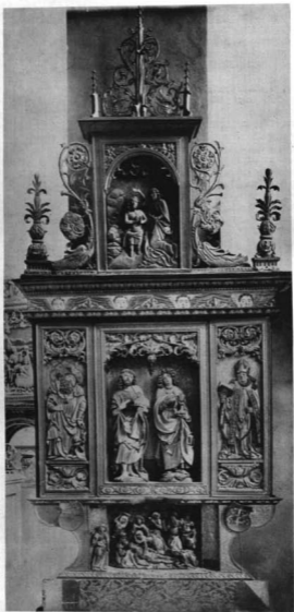
A LŐCSEI SZENT JÁNOS OLTÁR EREDETI ORMÁVAL