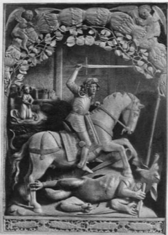
A SZEPESSZOMBATI SZENT GYÖRGY OLTÁR KÖZÉPSZEKRÉNYE LŐCSEI PÁL MŰHELYEBŐL. 1804–1816 KÖRÜL