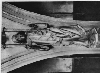
SZENT KOZMA SZINEZETT ALARÁSTRÓMSZORPRA A LŐCSÉI SZENT JAKAB TEMPLOM ORGONAKARZATÁNAK PILLÉREN, 1510 körüli