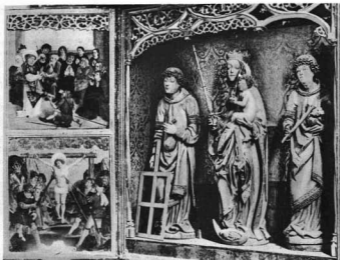
KÁPOSZTAFALVI FŐOLTÁR LŐCSEI PÁL MŰHELYÉBŐL