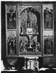
SZENTSÉGOOLTÁR LŐCSEI PÁL MŰHELYÉBŐL. XVI. század. Liptószentmiklós