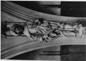
SZENT BOKUSZ SZINEZETT ALARÁSTRÓM-SZORPRA A LŐCSÉI SZENT JAKAB TEMPLOM ORGONAKARZATÁNAK PILLÉREN, 1510 körüli