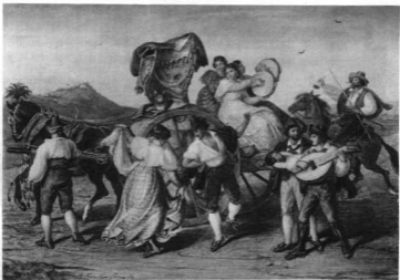
THAN MÓR: TARANTELLA TÁNCOLÓK. Róma. 1859 Pósnagy Aladár ár gyűjteményéből