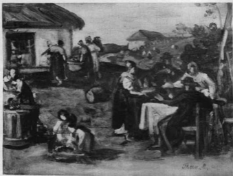
THAN MÓR: A SZŰRET. Vázlat Orsz. M. Szépművészeti Múzeum