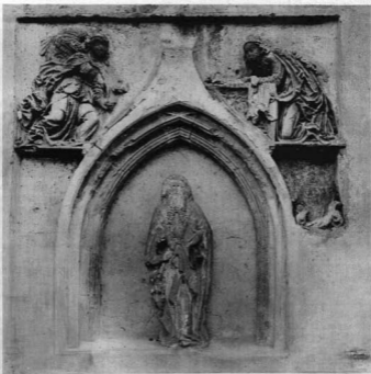
A BÉSZTERCEBÁNYAI PLÉBÁNIATEMPLOM CORPUS DOMINI KÁPOLNÁJÁNAK AJTÁJA S KERETÉBEN A HASONLÓLUL ELPUSZTULT SZENT ANDRÁS KÁPOLNA KÖSZÖBRA. 1471