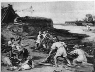
THAN MÓR: A HALÁSZAT. Vázlat Orsz. M. Szépművészeti Múzeum