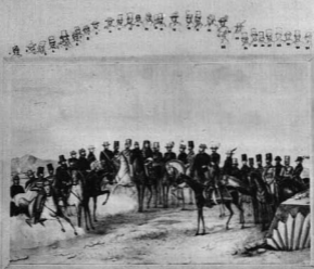
SŐKEZ BÉNYEK KÖRNYELÉBEN, SÉPESVÁROSI ALJAL, KÖRNYELÉBEN, AZ 1894. ÉVI JÚNIUS 20. ALMÁRÓSI CSAPATBAN TÖRTÉNT MEGHÍVÁSRA OTTAL.