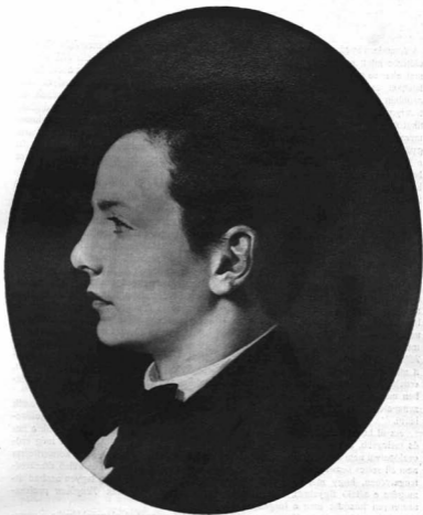
PÁLLIK BÉLA (1845–1908): TISZA ISTVÁN GRÓF IFJÚKORI-ARCKÉPE