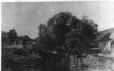
MÉSZÖLY GÉZA (1844–1887): VÍZ PARTIÁN