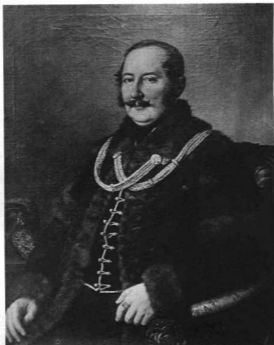
BARABÁS MIKLÓS: TISZA LAJOS ARCKÉPE. 1844

Barabás Miklós , a régi magyar társadalom legtermékenyebb és legkedveltebb képmásfestője, alkotta a Tisza-család arcképeinek legértékesebbjeit. A már előbb említett Tisza Lajosról és feleségéről Teleki Juliánnról 1844-ben két kitűnő arcképet készített. 1 Kétségtelenül a mester legjobb idejéből valók a portrék és Barabás legközvetlenebb, festőileg legfinomabb olajképei közé tartoznak. A legkiválóbb Waldmüllerekkel is kiállják a versenyt. Tisza Lajost cobolyprémes mentében, vörös atillá-