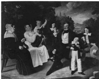
KISS BÁLINT (1802–1868): TISZA LAJOS CSALÁDJA KÖRÉBEN. 1840 (?)