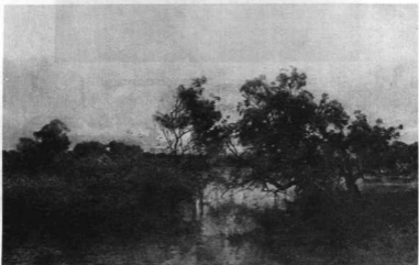
MÉSZÖLY GÉZA: NAPLENTÉ A MOCSÁRON. 1878