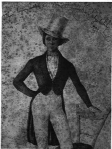
ZICHY MIHÁLY: ÖNARCKÉP. 1840. Vízfestmény Szépmővészeti Múzeum

Ez a kettősség Zichy Mihály életének és művészetének egyik nagy ellentéte. Egyéniségének ez a bölcelő szabása