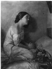
ZICHY MIHÁLY: IMÁDKOZÓ LEÁNY. 1846 A Zichy-ereklényi múzeum (Zala) tulajdonsága

Olyan korban, amikor a színproblémák uralkodtak a festőművészetben, amikor a