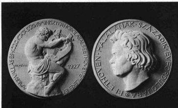
REMÉNYI JÓZSEF: BEETHOVEN-EMLEKÉREM