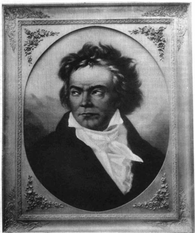
SCHIMON FERDINAND (szül. Pesten 1797. — megh. 1857): LUDWIG VAN BEETHOVEN (1770—1827)