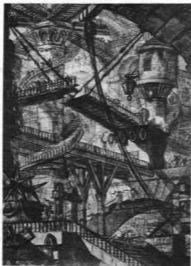
GIOVANNI BATTISTA PIRANESI: A BÖRTÖNÖK (CARCER) CÍMŰ RÉZKARCSOROZATBÓL