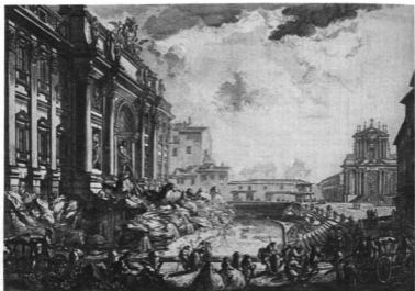
GIOVANNI BATTISTA PIRANESI: A FONTANA DI TREVÌ. Róma, 1751