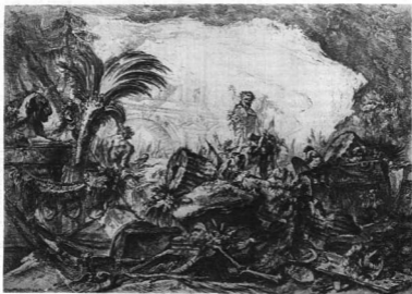
GIOVANNI BATTISTA PIRANESI: CAPRICCIO. Rézkarc. 1744—45 körül