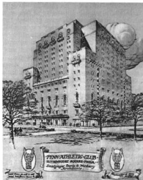
ZANZINGER ÉS MEDARY : PENN ATHLETIC CLUB PHILADELPHIA.

abszolút művészi becsű tárgyakat vásároljanak. Így aztán csaknem minden múzeumban akad néhány kiváló műtárgy.