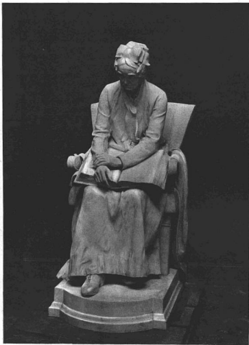
STRÓBL ALAJOS: ANYÁNK. Szépművészeti Múzeum.