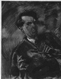
MÁRFY ÖDÖN: ÖNARCHÉP. A Képzőművészek Új Társasága kiállításából.