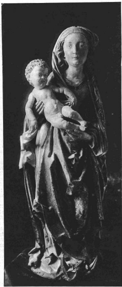
HANS TILMANN HIEMENSCHNEIDER: MADONNA. A Sztéphanészeti Múzeum dí szerzeménye.

URSZ. M. VILK KÉPZŐMŰVÉSZETI MŰKÖZMŰVÉSZETI