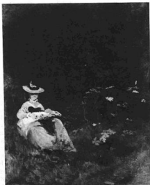
BENCZÚR GYULA: ERDŐ SZÉLÉN. A Szépművészeti Múzeum új szerzeménye.

nyílnak elragadóan szép darab, amely mestere művészetének legjellemzőbb tulajdonságait: beható természetismeretét, nemes komponáló tehetségét, fejlett dekoratív érzékét (főként a drapériák elrendezésében) és az érzelmesen szép felé vágyódó gyengéd lényét kiváló módon képviseli. Riemenschneider ugyan bizonyos tulajdonságai- val már a reneszánsz törekvéseit szolgálja, de még teljesen a gótikus szobrászat hagyományainak alapján mozog. Álló Madonnáján félfoldalt megferdült alakja, az előrerúgó felsőpó, a Madonna és a gyermek Jézus fejének kissé aránytalan nagysága mind gótikus hagyomány. A kései gót szobrászati stílus ismertetőjele barokkosan túlzott ráncvetődésű drapéria-kezelése is, a mély bevágásokkal. De a mód, ahogyan a Bambinót a nézővel szembe fordítja úgy, hogy ruhátlan testcskéje teljes kiterjedésében látható legyen, a mintázásnak minden gótikus elfogódottsága mellett is a reneszánsz akt-kultuszára emlékeztet.