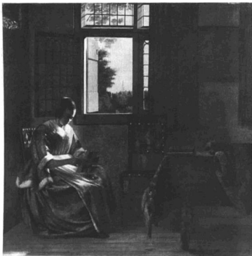
PIETER DE HOOCH: INTÉRIEUR LEVELET OLVASÓ NŐVEL.