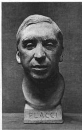
HILDEBRAND ADOLF: PLACCI KÉPMÁSA. A Szépművészeti Múzeum új szerzeménye.