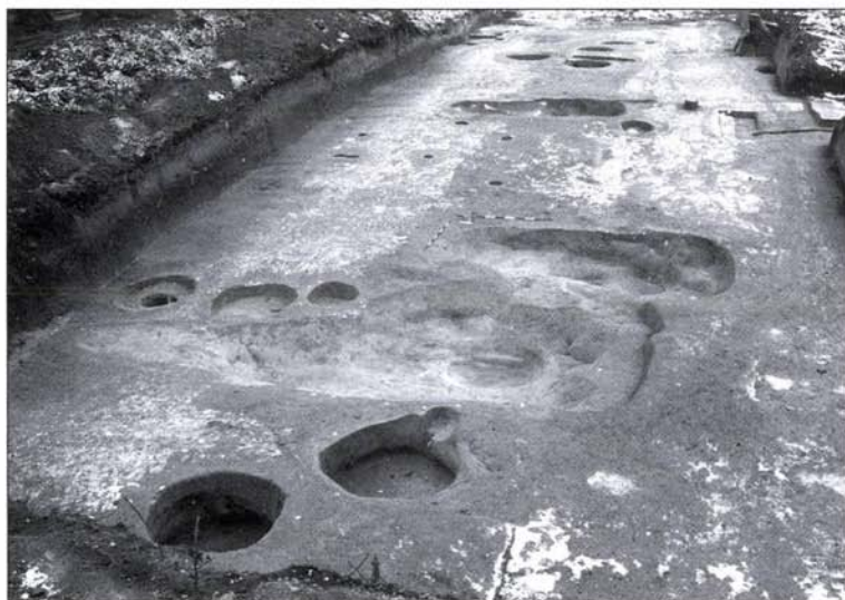
4. kép: A „B” épület területe feltárás után keletről

Első ütemben, a Duna-part közelében elhelyezkedő „A” és „B” jelű épületek területén 5 m széles próbaszelvényeket húztunk. Az „A” épület esetében vékony fekete-vörös salakos réteg és 40–60 cm vastag homokos feltöltés, majd átlagban 50 cm vastagságban megmaradt szürkésbarna iszapos természetes réteg alatt értük el a sárga altalajt, amely nyugati irányban a pincetömb alapozási síkja alá mélyült.