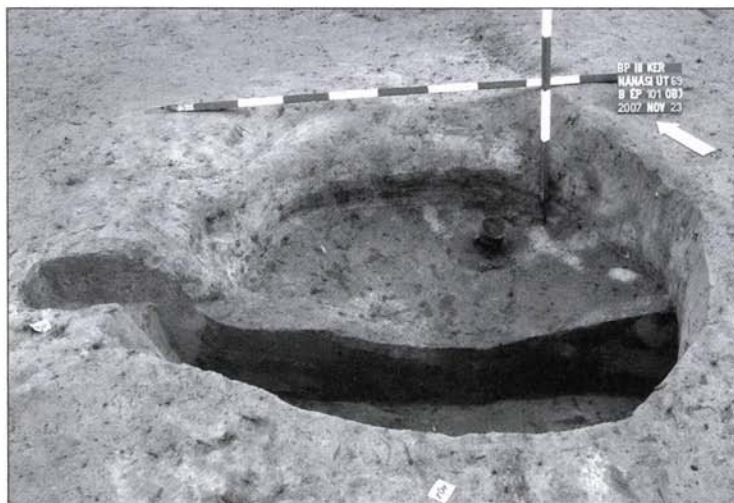
5. kép: Rézkori gödör feltárás közben, betöltésében bedobott edénnyel

gat-keleti irányban húzott kutatószelvényekben, a kissé keletebbre fekvő „C” és „E” épületeknél, kelet felé az altalaj erőteljes mélyülését és a régészeti jelenségek ritkulását tapasztaltuk. A próbafeltárás során kibontott objektumok mindhárom szelvényben a Dunántúli Vonaldíszes Kerámia (továbbiakban DVK) időszakára, egy esetben biztosan annak Kottafejes szakaszára, keltezhetőek. Vélhetően a DVK-hoz kapcsolhatjuk majd a „D” és „E” épületek területén jelentkező oszlopszerkezetek részleteit is. A tervezett épületek helyének teljes megelőző feltárását a II. ütemben, 2008. tavaszán végezzük el.