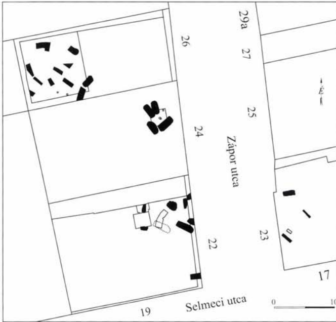
7. kép: Késő római temetkezések összesítő alaprajza a Zápor és Selmeci utcákban

leletanyag azonban nem került elő belőle. Az északi részben lévő, tegulákból épített, kirabolt sírban a váznak csak a bal karja maradt eredeti helyén. Mellékletet ebben sem találtunk. A sír egyik tégláján a legio II adiutrix, tabula ansatas bélyege látható.