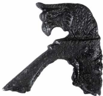
6. kép: Bronz griff-fejes borotva töredéke

A feltárásokat a Vörösvári út felőli telekrészen kezdtük meg, ahol korábban, az ettől északra eső telkeken (KIRCHHOF 2007, 51; BUDAI BALOGH–KIRCHHOF 2007, 260) már megfigyelt, középkori–kora újkori, sárga köves észak–déli irányú út keleti szélénél két periódusát dokumentáltuk. A hasonló nyomvonalú, de ettől kissé keletebbre haladó római út szintjét az alapozási síkkal nem érték el, ezért ennek feltárására nem került sor. A római út metszetét az újkori pince elbontása után feltehetően majd dokumentálni tudjuk.