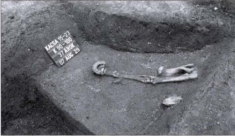
11. kép: Az árokban fekvő patkolt ló láb