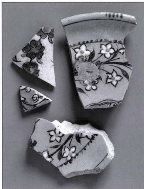
9. kép: Izniki fajansztöredékek

M. VIRÁG 1992 – M. Virág Zs.: Újkőkori és középső rézkori telepnyomok az M0 autópálya szigetszentmiklósi szakaszánál. In: Havasi P – Selmeczi L. (szerk.), Régészeti kutatások az M0 autópálya nyomvonalán I. BTM Műhely 5. Budapest 1992, 15–60.