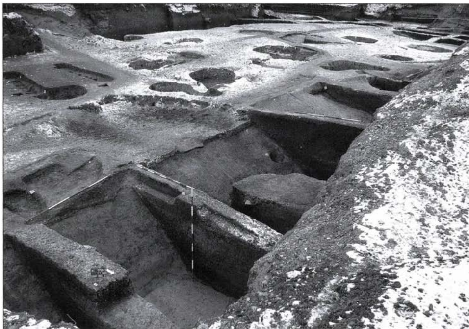
2. kép: A középső bronzkori települést délről védő hatalmas árokrendszer, oldalfalában a rajta átvezető cölöphíd egyik oszlophelye

Ezt követően, a területen tervezett lakópark építését megelőzően, a Római Horizon Kft. megbízásából végzett másfél hónapos próbafeltárás már a leendő hét épület (A1-2, B1-3, C1-2) területének régészeti fedettségét volt hivatott tisztázni. Miután a munka előrehaladtával hamar nyilvánvalóvá vált a teljes telek régészeti érintettségének ténye, a december 21-ig történő hosszabbítás keretében a beruházói szándékhoz igazodva a telek déli felén épülő 4 lakótömb (A1, B1-B2, C1) teljes megelőző feltárását végeztük el.