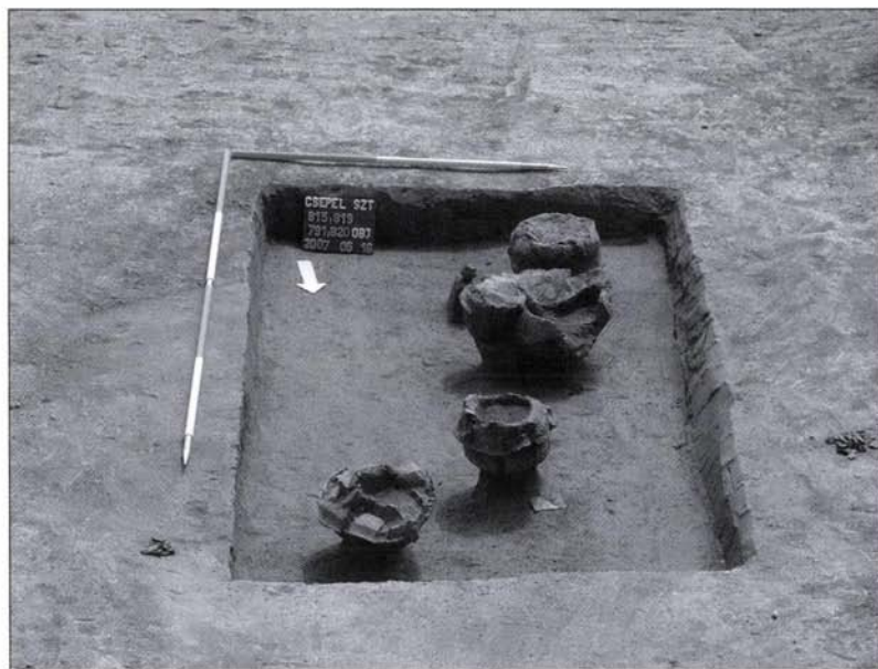
12. kép: A kora bronzkori Nagyév-kultúra sírcsoportja

A Budapesti Történeti Múzeum Ős- és Népvándorlás kori Osztálya, a Budapest Főváros Önkormányzata, Polgármesteri Hivatal, Közmű Ügyosztályának megbízásából, 2004-ben a (HORVÁTH 2005), és 2006-ban (HORVÁTH–ENDRŐDI–MARÁZ 2007) mintegy 12,5 hektáros területen folytatott megelőző régészeti feltárásokat Bp. XXI. ker. Csepel – sziget északnyugati csúcsán, a Nagy-Duna sornak nevezett területen. Munkánk során,