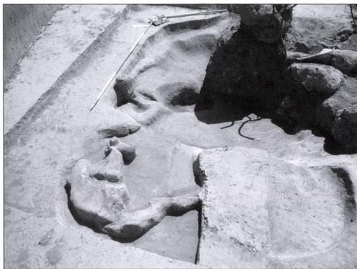
13. kép: Árpád-kori kemencék, és a hamuzó gödör maradványai

az első két szezomban 789 régészeti jelentőséget regisztráltunk és tártunk fel.