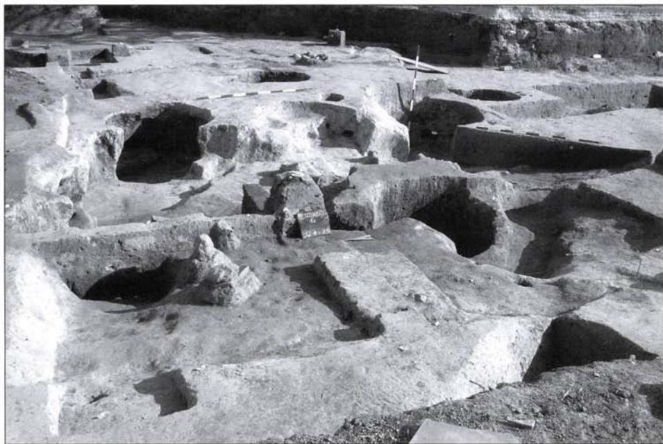
8. kép: Egymásba ásvó őskori gödrök komplexuma

A dombháton feltárt bronzkori gödrök leletei közé keveredve a Dunántúli Vonaldíszes Kerámia (továbbiakban DVK) idősebb fázisába tartozó gazdag leletanyag is napvilágra került. A leletek a DVK idősebb, Bicske-Galagonyás (MAKKAY 1978), Szigetszentmiklós-Vízműtelep (M. VIRÁG 1992), Dunakeszi-Székesdülő (HORVÁTH 2002) típusú leletekkel meghatározható időszakba sorolhatók. Fontos kronológiai támpontot jelent a besimított és polírozott felülettel, ill. mintával ellátott kónikus tálak előfordulása. Ugyancsak in-