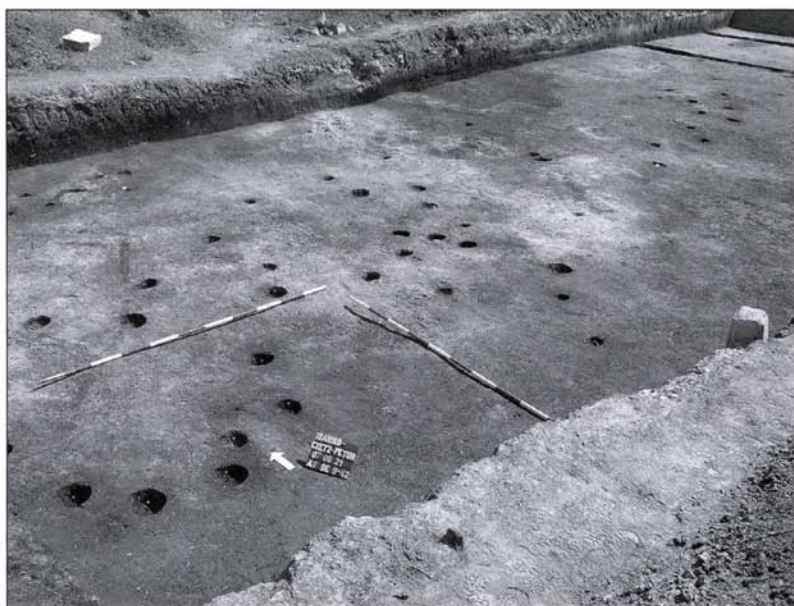
3 kép: Római kori árkok és karólyukak bontás után

mokháttakkal, míg nyugat felé mélyedések tagolták a felszínt és ebben a zónában lehet elsősorban forrásokkal számolni.